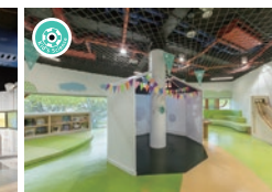
キッズ・サイエンス・ランド